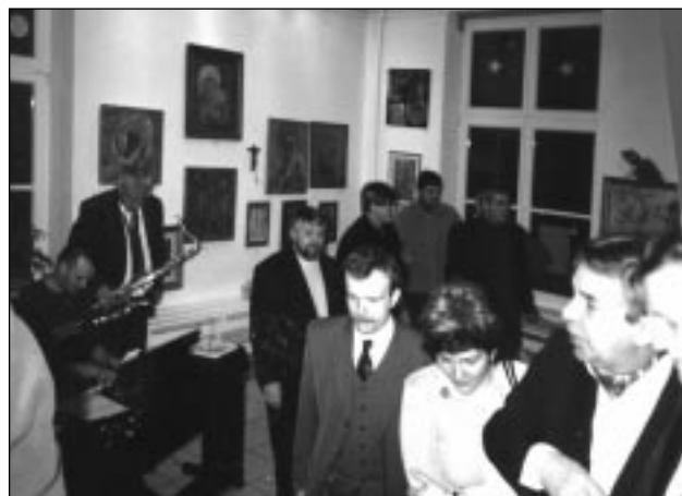
Sala zappełniła się gośćmi z bliska i z daleka, podczas imprezy panowała bardzo rodzinna atmosfera

w wielopokoleniowej rodzinie artystów malarzy i rzeźbiarzy, kontynuuje rodzinne tradycje. Oprócz pasji artystycznej interesuje się przyrodą. Od 2000 roku maluje bardzo dużo techniką pasteli olejnej, mieszaną oraz farbami olejnymi. Wybiera tematy własne, lecz wykonuje również autorskie kopie wielkich Mistrzów i wielkich dzieł malarstwa. W tym czasie ukończył ponad 350 prac, z czego większość znalazła nabywców w kraju i za granicą. Podczas słynnej Wystawy Impresjonistów w 2001 roku pastela „Mostek z ka-