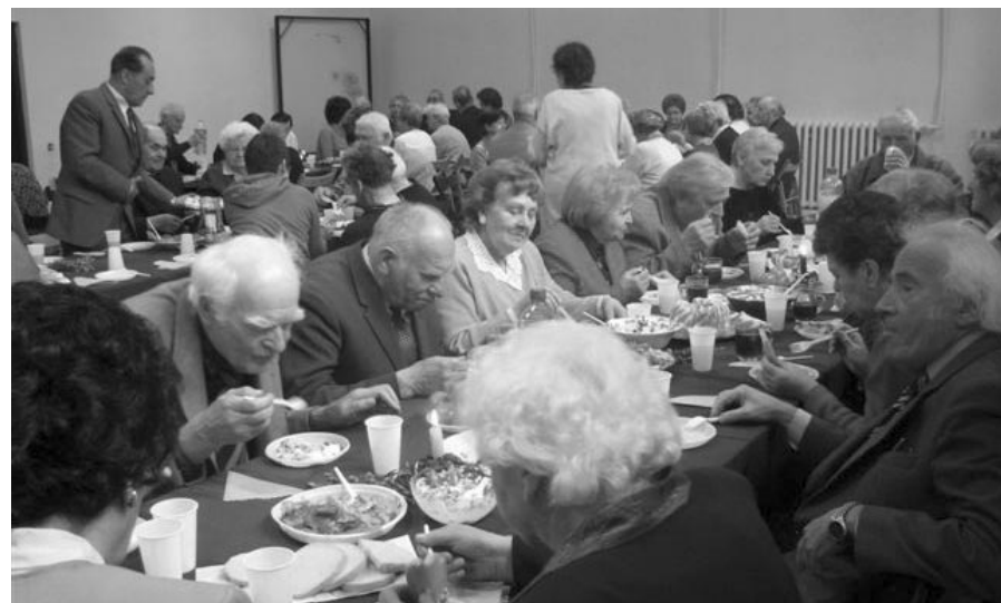
Fot. D. Sulinowska/MCI

Miejskie Centrum Informacji Dorota Sulinowska